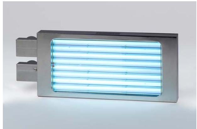
Bild 4: BlueLight UV-Entkeimungsmodule ermöglichen die schnelle und sichere Entkeimung von Packstoffen und Oberflächen in der Lebensmittelindustrie

Anlagen nachgerüstet werden. UV-Entkeimungsmodule werden in verschiedenen Größen angeboten und können der Materialbreite angepasst werden.