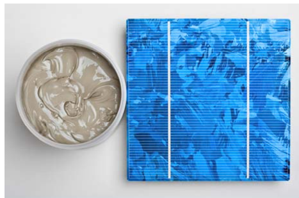
Bild 3: Silberhaltige Pasten stellen die Ableitung des Solarstromes aus den Siliziumzellen bei möglichst geringer Abschattung der Solarzelle sicher.

Die umweltfreundliche Photovoltaik erlebt derzeit einen Boom. Zahlreiche Produkte von Heraeus wie Infrarotlampen oder Sputtertargets spielen bei der Produktion von Solarzellen eine Rolle. Solarzellen werden heute zum überwiegenden Teil aus Silizium-basierten Wafermodulen hergestellt. Ein alternatives Herstellungskonzept sind Dünnschichtmodule. Verglichen mit kristallinen Solarzellen aus Siliziumwafern sind Dünnschichtzellen hundertmal dünner. Heraeus entwickelt für beide Konzepte Produkte zur Beschichtung, Verbindungstechnik und Wärmetechnik. Neben Sputtertargets gehören dazu silberhaltige Pasten, die die Ableitung des Solarstromes aus den Siliziumzellen bei möglichst geringer Abschattung der Solarzelle sicherstellen. Auch Infrarotwärme kommt bei der Produktion der Solarzellen zum Einsatz. Bei der Herstellung der Zellen erhalten die Basismaterialien Beschichtungen bei hohen Temperaturen im Vakuum. Heraeus hat für die Photovoltaik neue Strahler mit einem Reflektor aus opakem Quarzglas entwickelt, mit dem Wärmeprozesse bei der Fertigung von Solarzellen stabilisiert und optimiert werden können.