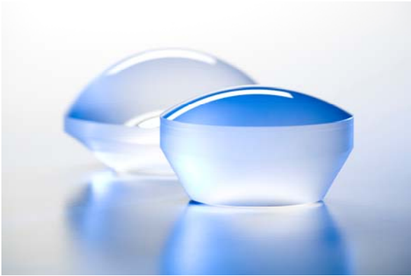
Bild 1: Linsen aus „selbstheilendem“ Suprasil® 501 – eine Innovation für die Mikrolithografie

chips. In seinem Leben als Linsenmaterial muss Quarzglas u. a. den Beschuss von über 200 Milliarden Laserpulsen unbeschadet überstehen. Diese Anforderung erfüllt Suprasil® 501. Grund: Im Quarzglas vorhandene Wassermoleküle heilen laserinduzierte Defektzentren wieder aus, die ansonsten eine Verschlechterung der hervorragenden optischen Eigenschaften verursachen würden.